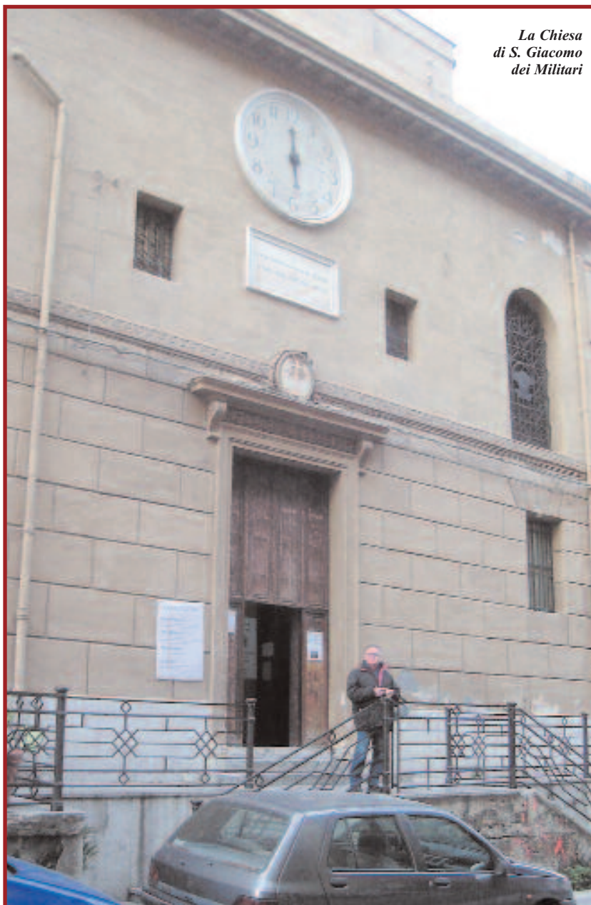
La Chiesa di S. Giacomo dei Militari

La Chiesa attigua al Carcere Militare, eretta a sede parrocchiale nel 1933, fu all'inizio denominata S. Giacomo dei Militari in S. Isidoro: "S. Giacomo dei Militari" perché i documenti parrocchiali erano rimasti precedentemente custoditi nella Chiesa esistente presso la Legione dei Carabinieri e cioè nel Quartiere Militare S. Giacomo; "in S. Isidoro" per l'originaria denominazione della Chiesa. Solo in seguito per decreto del Card. Pappalardo del 30 giugno 1986, fu soppressa la dizione "in S. Isidoro", e la denominazione ufficiale della Parrocchia rimase quella attuale, mentre la cura di quest'ultima fu affidata alla Comunità dei Carmelitani Scalzi, che vennero così a recuperare ciò che era stato loro tolto quasi due secoli prima.